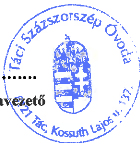
Várhegyi Éva megbízott óvodavezető